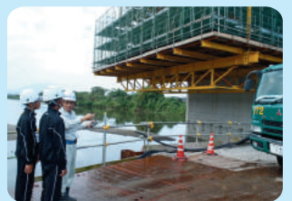
しらすぎ橋の現場