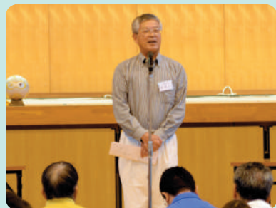
●高田肥文教育長ご挨拶