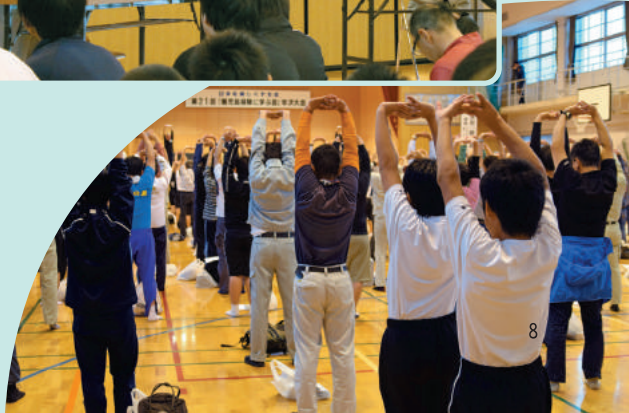
●よく伸ばしましょう!