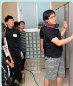
●真剣に耳を傾けます