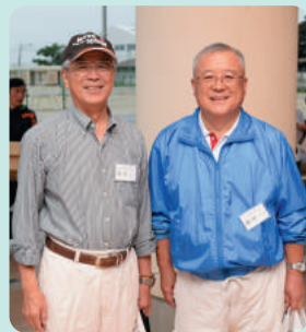
●素晴らしい笑顔です