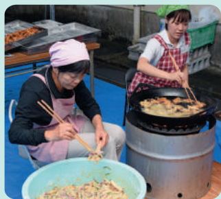
●今年もガネがおいしそう!